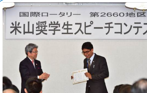
11月5日開催 スピーチコンテスト 優秀賞！！

皆さん改めまして今晚は、今日はあいにく、朝からの雨となっていまいましたが、会員の皆さまをはじめ奥様そして、ご家族の皆さまに多数のご参加を頂きまして誠にありがとうございます。